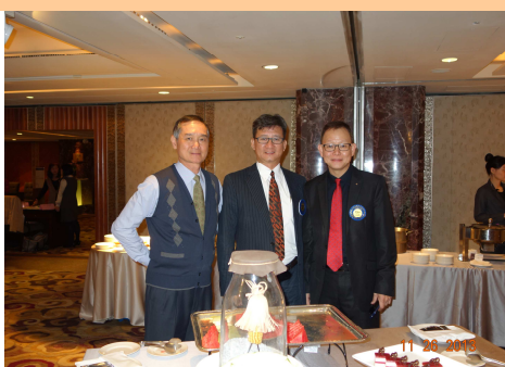
• 社友合影花絮一帥哥團