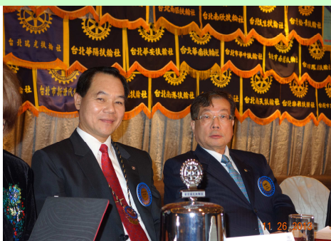
• 社長與瑞光社 P Peter